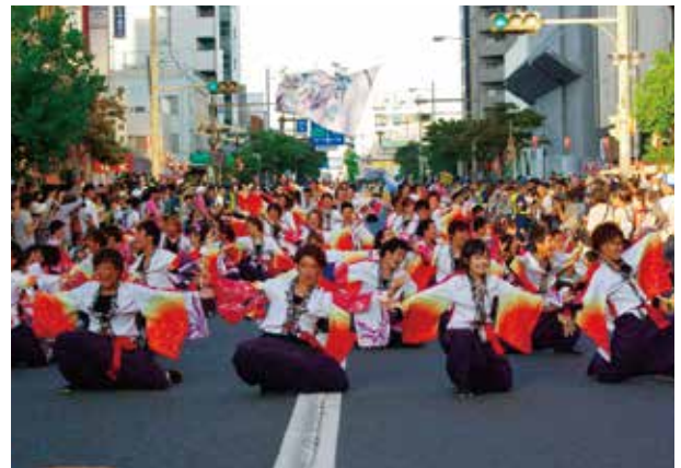
課外活動（よさこいソーラン風神部）