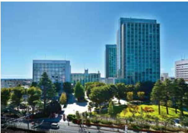
津田沼キャンパス