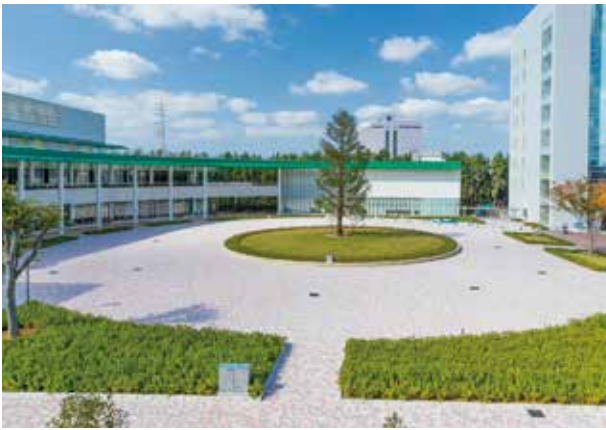
新習志野キャンパス（食堂棟）