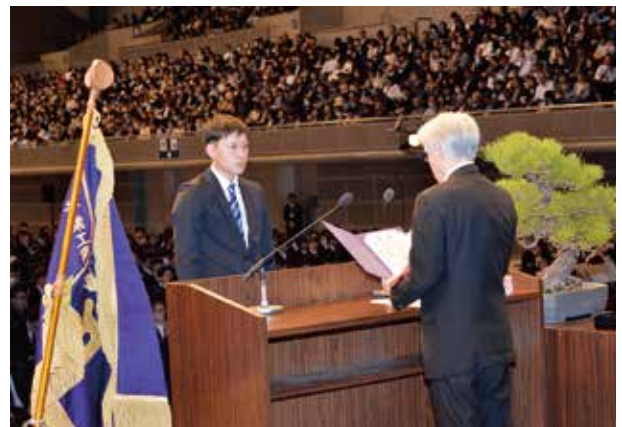
学位記授与式（PPA会長賞授与）