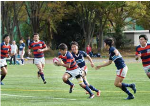
課外活動（ラグビー部）