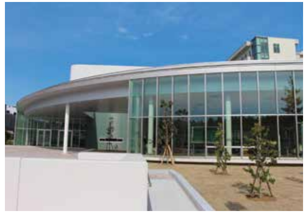
新習志野キャンパス（体育館）