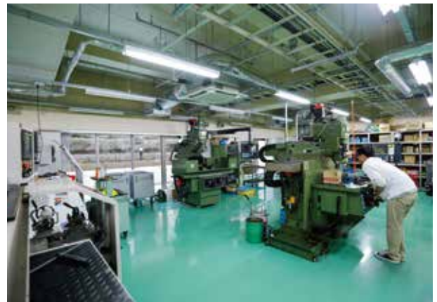
津田沼キャンパス（工作センター）